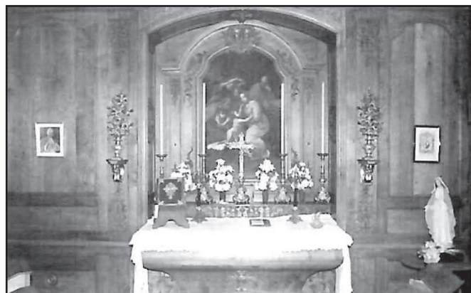
L'oratoire du château de Magnanne où s'est très probablement rendu saint Louis-Marie Grignon de Montfort

A quand remontent ces liens du marquis de Magnanne avec les jésuites ? Il est impossible de le préciser. Peut-être pour ses études, a-t-il fréquenté leur collège voisin de la Flèche (l'actuel Prytanée militaire) ? Il