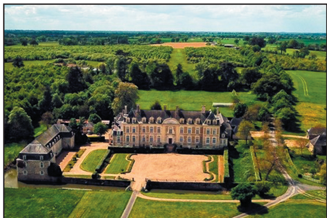
Le château de Magnanne